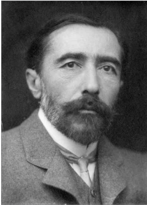
Joseph Conrad nel 1904.

Una cassa di legno, lunga un metro, alta circa cinquanta centimetri, con tozze zampe quadrate contro le infiltrazioni del pavimento e la base leggermente più larga per resistere ai rollii della nave. In passato ogni marinaio degno di tale nome solcava le acque del mondo sempre accompagnato da questa specie di baule, chiamato in gergo cassetta.