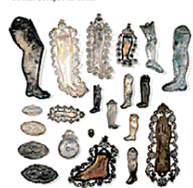
La copertina del libro

vati delitti» che spinge a caleidoscopiche ricostruzioni e divagazioni voyeuristiche. Scova lettere, scartafacci, appunti e certificati di ogni genere, ricordi smarriti nel fondo dei cassetti con cui riunire ciò che la morte ha separato, testamenti dispersi per ridare voce a chi non ne ha più, eredità e legati che combattono le tenebre dell'oblio. Si addentra nei cimiteri, non-luoghi per eccellenza eppure terri-