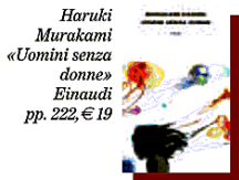
Haruki Murakami «Uomini senza donne» Einaudi pp. 222, € 19

Ogni tanto sento il bisogno di perdersi per qualche ora nella prosa di quest'uomo. Mi fa viaggiare in luoghi lontanissimi che si trovano tutti dentro di me