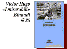
Victor Hugo «I miserabili» Einaudi € 25

Ogni tanto sento il bisogno di perdersi per qualche ora nella prosa di quest'uomo. Mi fa viaggiare in luoghi lontanissimi che si trovano tutti dentro di me