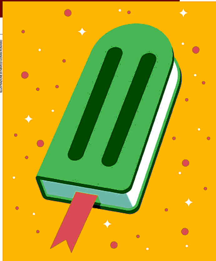
ILLUSTRAZIONE DI MARCO ROMANO

Questi quattro racconti sono una lavatrice dello spirito, ti mettono davanti alla vita: non come dovrebbe essere, ma com'è