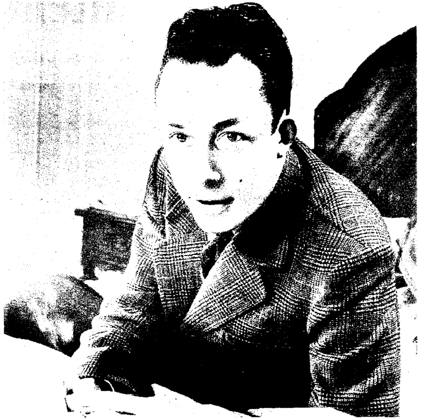
Albert Camus, premio Nobel per la letteratura nel 1957, morì nel gennaio del 1960