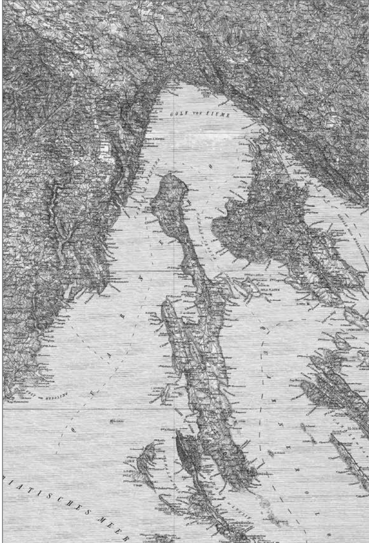
Il Quarnaro con le isole di Veglia (Krk), Cherso (Cres) e Lussino (Lošinj).