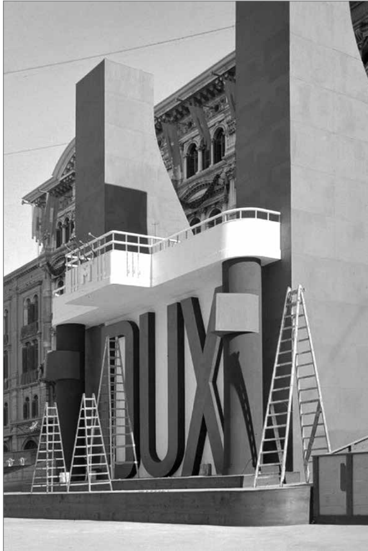
Trieste, 1938: si allestisce il palco in piazza Unità d'Italia prima del discorso di Mussolini noto per avere preannunciato l'introduzione delle leggi razziali.

Nei riguardi della politica interna, il problema di scottante attualità è quello razziale. Anche in questo campo noi adotteremo le soluzioni necessarie. Benito Mussolini a Trieste, 18 settembre 1938