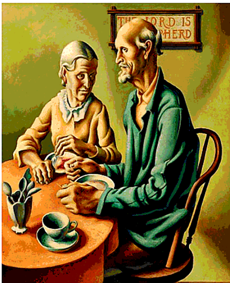
Thomas Hart Benton, "The Lord is my shepherd", 1926

Come imperdibile è "Le ragazze del Dakota" (Marsilio editore) di Gwen Floris, scrittrice e giornalista americana, candidata ben tre volte al Premio Pulitzer che ci conduce, magistralmente, nel cuore più torbido del Midwest più rurale, quello tutto "Bibbia&Fucile", tra riserve indiane, pozzi di petrolio e terre selvagge ambientando uno dei migliori gialli dell'anno: perché ci porta nella realtà di quei posti dove la vita umana sembra non valere nul-