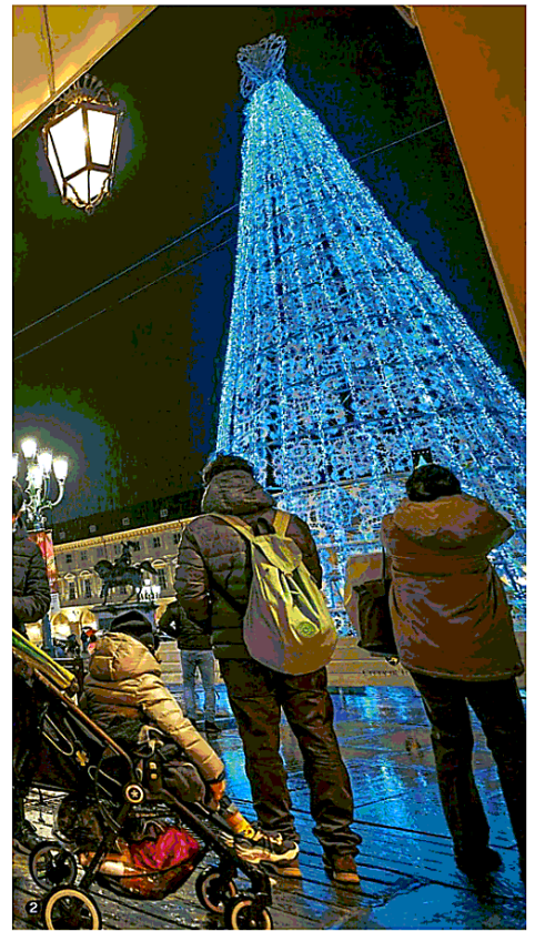
Scoprire il Natale facendo shopping in piazza San Carlo. 1. Il calendario dell'avvento. 2. L'albero visto dai portici