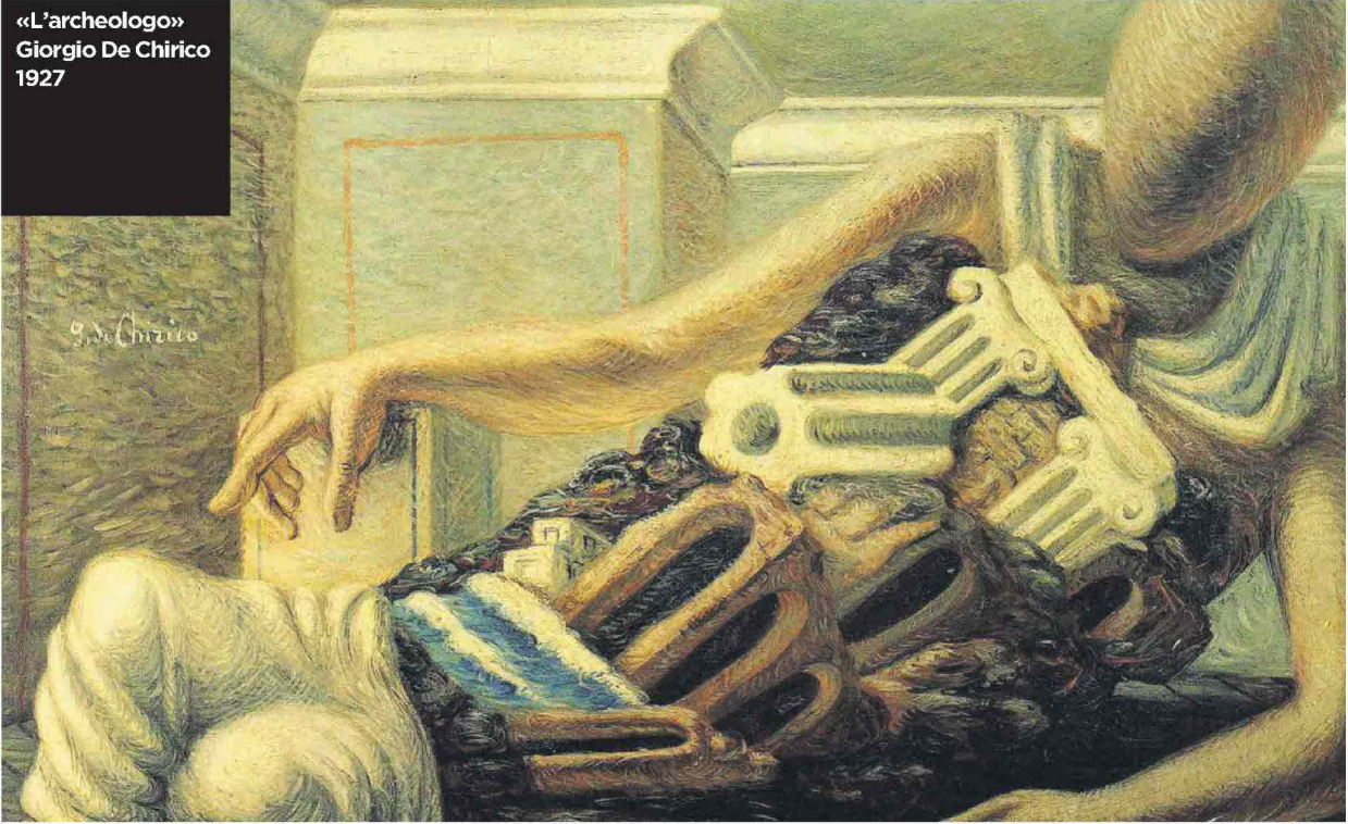
«L'archeologo» Giorgio De Chirico 1927