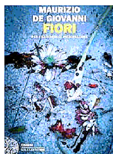
Il libro di Maurizio De Giovanni

to inizia di lunedì, quando quattro persone salgono su un ascensore di un grattacielo di Manhattan. Ciascuno preme il pulsante del proprio piano, ma l'ascensore continua a salire, senza sosta, fino all'ultimo piano, poi inizia a precipitare. Poco dopo tutta New York precipiterà nel caos». Da ultimo, il docente propone "Il lato nord del cuore" (Dea Planeta) della spagnola Dolores Redondo. «Io e molti altri - conclude Sacco - la riteniamo la regina del th-