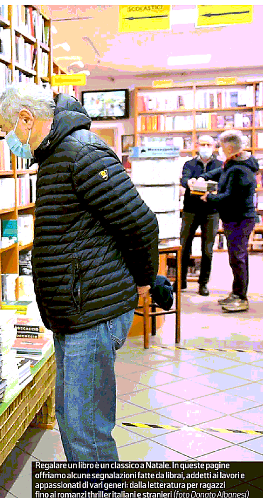
Regalare un libro è un classico a Natale. In queste pagine offriamo alcune segnalazioni fatte da librai, addetti ai lavori e appassionati di vari generi: dalla letteratura per ragazzi fino ai romanzi thriller italiani e stranieri