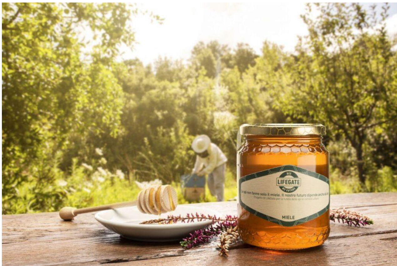
Miele biologico prodotto dall'iniziativa Bee my future di LifeGate.

Partecipando a Bee my Future si possono adottare per un anno cinquecento api degli alveari. L'apicoltore, oltre a prendersene cura, le utilizza per la produzione di miele biologico. Con l'adozione si può scegliere un kit da 4, 8 o 12 vasetti di miele da mezzo chilo, con tanto di etichette da brandizzare a proprio piacimento.