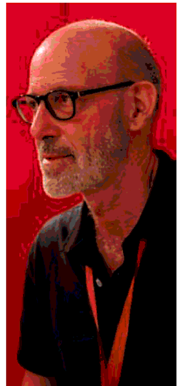
Marco Dell'Omo La banda Gordon, Nutrimenti 352 pagine, 17.10 euro

continuano ad uscire e quindi si tratta solo di una montatura. Per contrappasso i ragazzi comprendono il senso della libertà di espressione e della censura e seppure vengono in alcuni casi da famiglie fasciste, o addirittura come Piero sono nipoti di Gabriele D'Annunzio, si sentono di dover combattere la loro battaglia per un futuro in cui poter leggere i fumetti preferiti senza che nessuno lo possa impedire. Insomma, un romanzo di formazione nel quale l'autore mescola con maturità efficace una grande quantità di elementi diversi senza però che il risultato sia contraddittorio o confuso, anzi sembrano naturali cose assolutamente decontestualizzate. Una serie di ingredienti che, non so quanto consapevolmente o meno, sembrano mixati per dare vita ad una perfetta serie televisiva di quelle che non faticherebbero a diventare di culto tra un pubblico di adolescenti. Non soltanto perché i ragazzi protagonisti sono tutti personaggi belli ed intriganti, perché c'è la storia, c'è la guerra e c'è l'amore, ma anche la natura delle montagne abruzzesi nel loro splendore, e poi il fumetto e anche un pizzico di superpoteri. Si perché in fondo, poteri