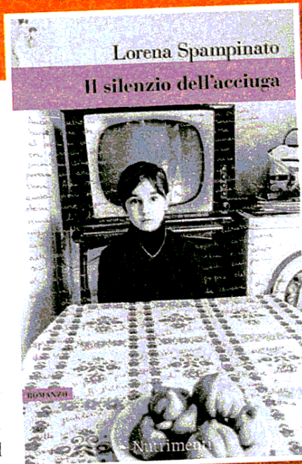
Lorena Spampinato IL SILENZIO DELL'ACCIUGA Nutrimenti, 240 pagg., 18 €

femmina non aveva niente a che fare coi capelli, con i vestiti, con le cianfrusaglie che mio padre mi aveva vietato persino di desiderare. Non c'entravano i modi di fare e di atteggiarsi, i lineamenti dolci, la prudenza dei gesti. Solo una cosa c'entrava...: la libertà. La libertà di essere quello che volevo essere, quando volevo. Ne fui sollevata. Nonostante questa lezione, Tresa si scontrerà con maschi burberi come il padre, che pur chiedendole "per favore", prendono quel che vogliono senza aspettare la sua risposta.