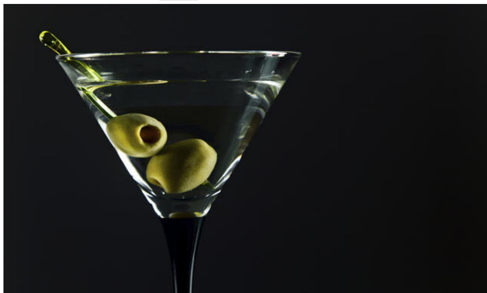
Un cocktail Martini

TAG: CAROLINA CUTOLO COCKTAIL MARTINI EDEN RACCOLTA DI RACCONTI RICETTE