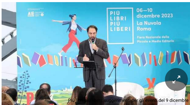
Più libri più liberi, suggerimenti per gli eventi del 9 dicembre