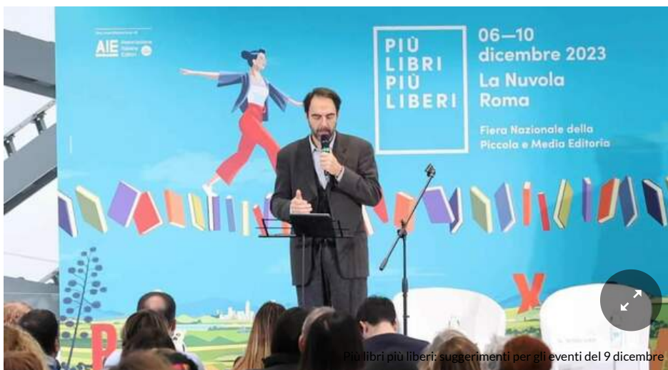
Più libri più liberi: suggerimenti per gli eventi del 9 dicembre